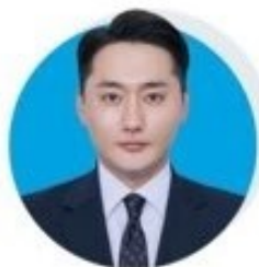
신 일 옥 자정장

무엇보다 경험이 중요한 시대. 기업이 나를 당당히 요구하고 선택할 수 있는 힘을 만들어야 합니다.