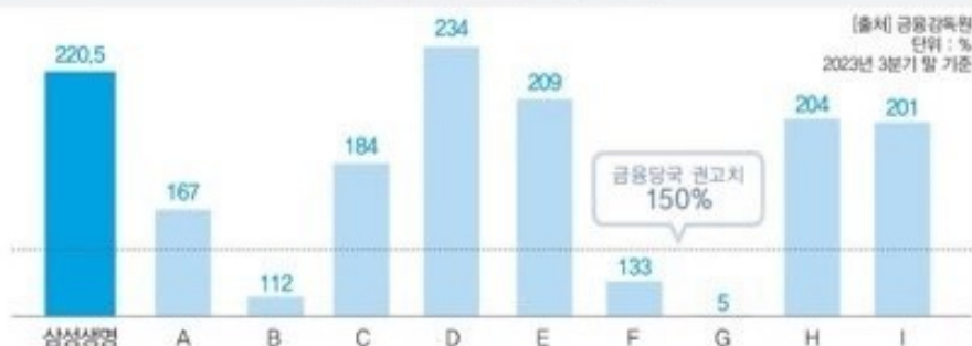
주요 보험사 신지급여력비율 (K-ICS)

지급여력비율(Risk Based Capital) : 보험금 지급 요청이 한번에 올랐을 때 보험회사가 보험금을 지급할 수 있는 여력