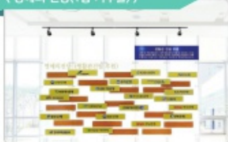
〈 명예의 전당(1층 기부율) 〉