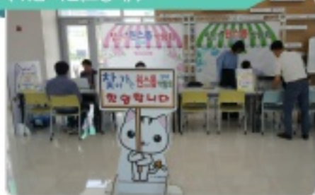
〈 취업 지원(고양시) 〉