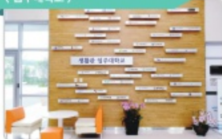
〈 입주대학교 〉